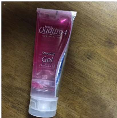
【シェーバー用ジェル】