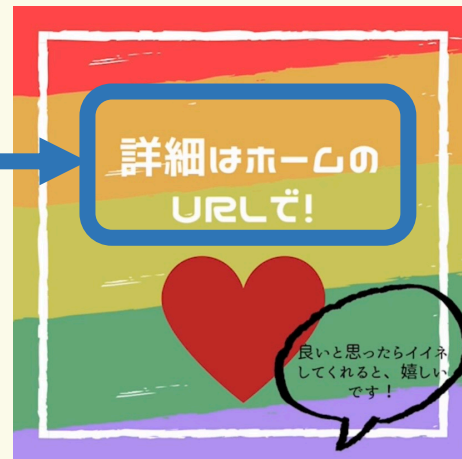
「演習ⅡA」クラスA Team 3