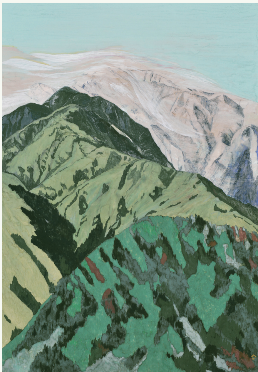
有元容子《甲斐駒ヶ岳》2019年 紙本着色