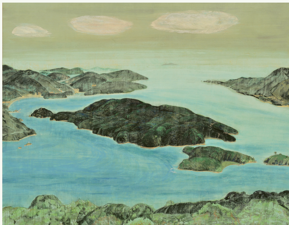
有元容子《島》2014年 紙本着色